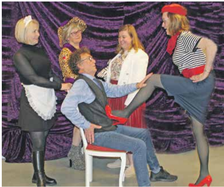
Een B&B alleen voor vrouwen, maar die staan hun mannetje wel zo te zien.

Even iets over het verhaal: Joop is een wat onzekere vrijgezelle man. Nadat zijn moeder in een verzorgingshuis is opgenomen, ziet hij zijn kans schoon om een B&B te starten. Zijn broer Bert (een man vol zelfvertrouwen) neemt echter al snel de regie over. De B&B is alleen bedoeld voor vrouwen, en de een na de andere bijzondere gast brengen Joop al snel met hun