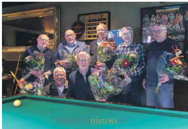
Met 50 jaar biljarten en kameraadschap hebben deze heren een bijzondere prestatie neergezet, een mijlpaal die niet onopgemerkt voorbij mocht gaan.

bond Logo ontvingen zij allen een prachtige bos bloemen als blijk van waardering voor hun jarenlange inzet en vriendschap. Dat de wedstrijd tegen de Wippert met 13-6 verloren werd mocht de pret absoluut niet drukken.