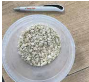
Stikstof in korrelvorm uit stal- mest ideaal voor de export.

Exel- In Bouwend Nederland van 14 maart 2025 lezen we dat de Stikstof de bouw van 244.000 woningen op slot zet en economische schade van 93,5 miljard euro dreigt. De Telegraaf van dezelfde dag vermeldt dat tien jaar fout stikstofbeleid door RIVM gehanteerde onjuiste modellen de kustvisserij en boeren op slot zette. Hoe frustrerend zijn deze meldingen voor alle betrokkenen wel niet. Ondanks dat de meningen verdeeld zijn over of het een echt of gecreëerd probleem is, blijft het feit dat veel instanties er wel mee te maken hebben en dat raakt ze vaak tot in het diepst van hun ziel. Zo ook de agrarische sector waar tal van schrijnende gevallen bekend zijn. Veehouders die niet