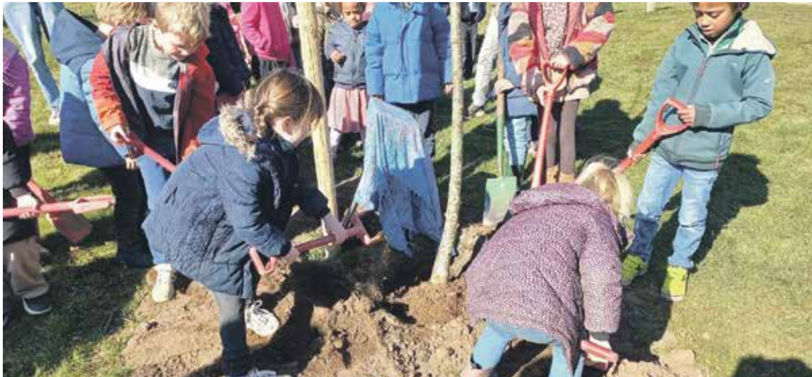
Kinderen van de Julianaschool in actie bij de feestelijke boomplanting op het terrein van zwembad De Berkel.

Almen- Nationale Boomfeestdag, woensdag 19 maart, had voor Almen dit jaar een extra feestelijk tintje. Op deze ochtend werd namelijk de ligweide van zwembad De Berkel verrijkt met een lindeboom. Vocaal Almen geeft de boom cadeau aan de bevolking van Almen ter