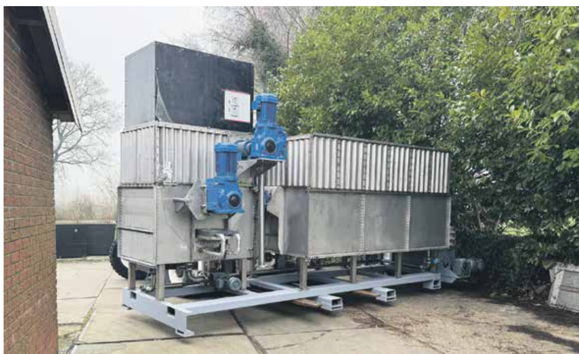
De mobiele mestverwerker die dit voorjaar met een landelijke primeur de mestwereld op zijn kop zal zetten.

Nu ongeveer twee jaar later zijn de werkzaamheden zover gevord