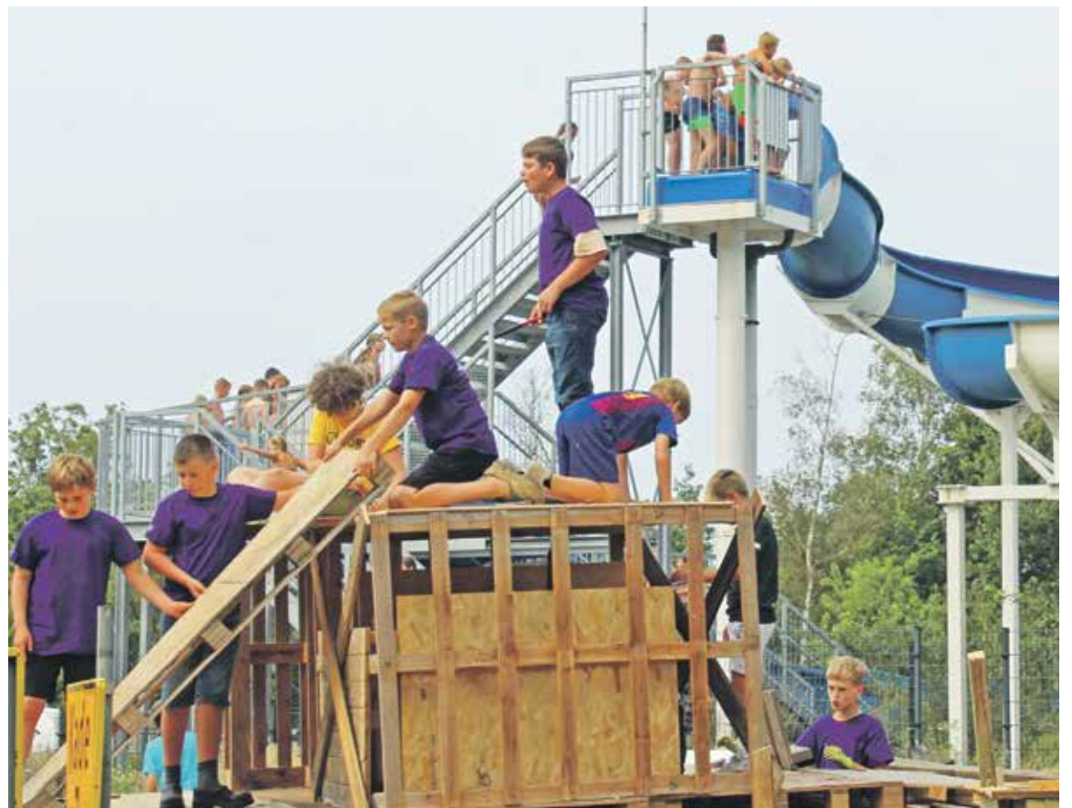
Terwijl ijverige bouwers zich uitleven op hun bouwwerk vermaken andere kinderen zich met de grote glijbaan.

Vrijdagmiddag konden de deelnemers verder werken aan hun bouwwerken en werd er ook enthousiast geschilderd. De schepen, vuurtorens en andere creaties werden voorzien van vrolijke kleuren en gedecoreerd met zelf meegebrachte versieringen. Om 17.00 uur verzamelden trotse familieleden en vrienden zich op het terrein om de creatieve bouwwerken te bewonderen. De deelnemers hadden al lekker gegeten en