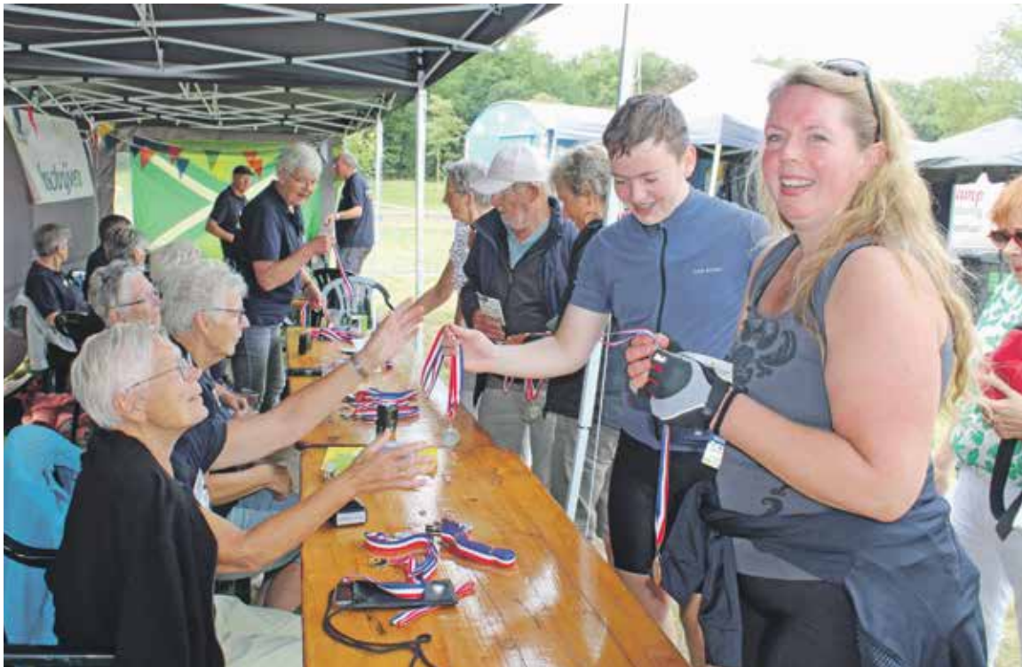
Aan tafel bij de medaille uitreiking krijg je een veelheid aan positieve reacties van de deelnemers over de afgelopen vier dagen te horen.

Laren- “Een beetje overweldigd door de grote belangstelling van vandaag”, is de reactie van de organisatie op dinsdag 5 augustus, de eerste dag van het fietsevenement. Geen wonder, want met 1200 fietsers die starten is het aantal deelnemers al groter dan het totaal van vorig jaar. Een geweldige opkikker natuurlijk. Een grotere stimulans kun je voor het