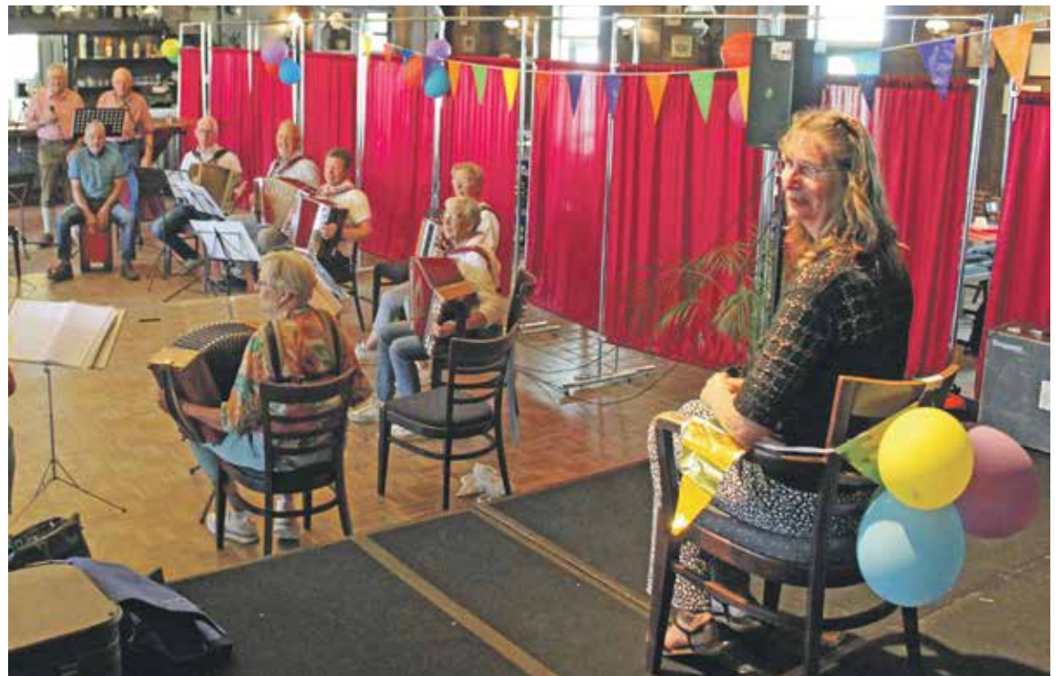
Zonder zelf in actie te komen kan de Dinie nu een muzikale aubade in ontvangst nemen van haar eigen steiergroep.

Zwiep- Vorig jaar tijdens het accordeon- en harmonicatreffen op de Heksenlaak ter gelegenheid van 75 jaar Zweverink Muziek, zocht bij temperaturen van boven de 30 graden iedereen zo snel mogelijk een plekje in de schaduw. Afgelopen zondag bij een zelfde vorm van muzikaal treffen was het niet zo heet, maar wel hartverwarmend.