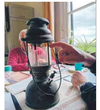
Deze olielamp zorgde in de oorlog voor licht op de boerderij.