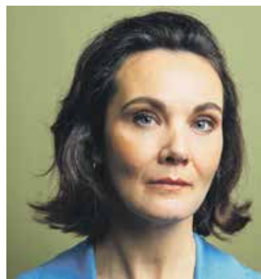
Voorstelling Lochem: "Je kunt me gerust een geheim vertellen".

In Dorpshuis Ons Huis Almen wordt om 19.30 uur de voorstel-