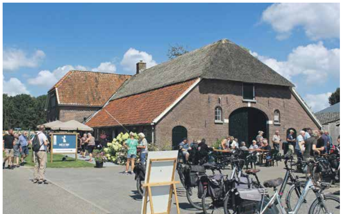
Zowel op het erf als op de deel is er bij Melktap 't Muldershuis plaats genoeg voor een maagversteving.

Laren- "We hadden gisteren een zonovergoten, prachtige Pannenkoekenrit voor (kinder)fietsers, auto's en oldtimer tractoren", schrijft toeristenbelang Laren maandag op facebook. Daar is niets teveel mee gezegd.