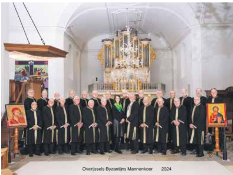
Overijssels Byzantijns Mannenkoor 2024

Het concert bestaat uit twee gedeeltes, voor de pauze zingt het koor hoofdzakelijk liturgische koormuziek en na de pauze zingen zij profane liederen uit Oost-Europa. De koorzang zal in de pauze worden afgewisseld met een optreden van een klarinet ensemble van het Symfonisch Blaasorkest uit Gaanderen. Aanvang concert 15.00 uur. De entree bedraagt 10 euro in de voorverkoop en 12,50 euro aan de kerk. De voorverkoopadressen zijn: Primera, Molenstraat 50, 7241 AE Lochem en Readshop, Zuivelweg 1, 7261 BA Ruurlo. Verder kan er ook via website www.OBMK.nl kaarten besteld worden.